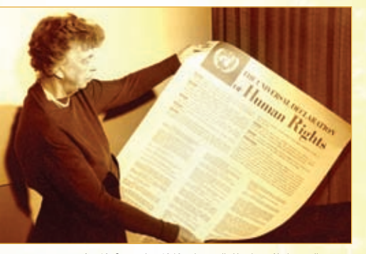
Am 10. September 1948 nahmen die Vereinten Nationen die Allgemeine Erklärung der Menschenrechte an. Eleanor Roosevelt hält ein Exemplar des Dokuments, für das sie sich unermüdlich eingesetzt hatte, in der Hand.

Die UN-Charta ermächtigte den ECOSOC, "... Kommissionen für wirtschaftliche und soziale Fragen und für die Förderung der Menschenrechte ..." zu etablieren. Eine solche war die Menschenrechtskommission der Vereinten Nationen. Unter dem Vorsitz der Menschenrechtsverfechterin Eleanor Roosevelt, der US-Delegierten für die UN,